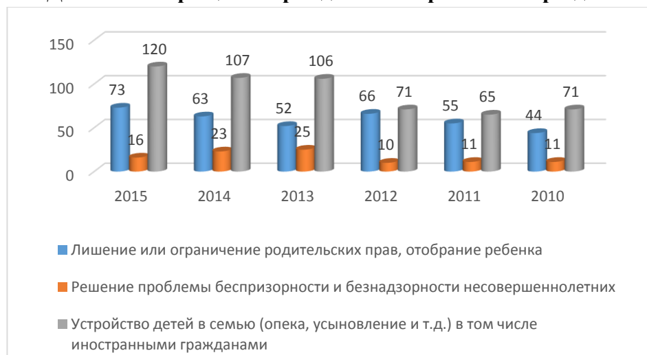
«Динамика обращений граждан по направлениям раздела»